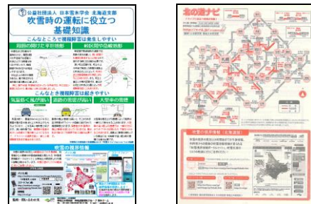
図-4 日本雪氷学会発行のパンフレット(左)、消防ダイアリー((公財)札幌市防災協会)(右)