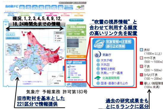
図-1 現況と予測情報【PC版】

平成 25 年 3 月の暴風雪災害から 3 冬期目を迎えて、PR 用チラシを道の駅や自治体などで配付した結果、市民向けの防災情報として今年もテレビで 7 件、新聞で 4 件報道(図-3)されるなど、これまでにテレビ、ラジオ及び新聞報道で 85 件報道された他、自治体広報誌、Twitter 等で広く紹介されました。このほか、各機関が市民向けに発行するパンフレットや消防ダイアリーなどで配付(図-4)されたり、測量設計業務安全ガイドブック((一社)北海道測量設計業協会)により工事関係者に配布されるなど、多くの方々に活用されています。