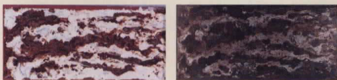
塩化ナトリウム水溶液を噴霧した場合