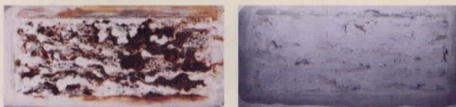
酢酸ナトリウム水溶液を噴霧した場合

写真は、塩化ナトリウム水溶液及び酢酸ナトリウム水溶液を亜鉛メッキ鋼板に噴霧してから、1,000時間経過したものです。右側の写真は、酸により表面の腐食生成物を取り除いたものですが、酢酸ナトリウム水溶液を噴霧した方が腐食の程度が軽微であることがわかりました。