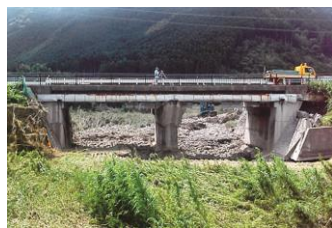
写真-1 大宮第二避溢橋全景