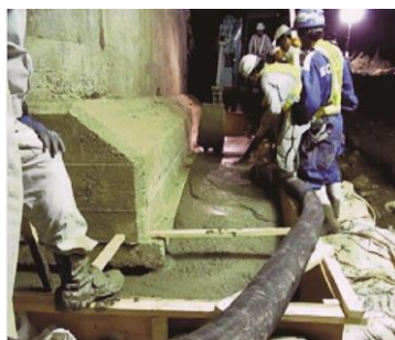
写真-3 コンクリート充填状況

P1橋脚フーチングの洗掘箇所周辺を早急に対応するために現地発生土を利用した大型土嚢で囲いその内側に型枠を並べ、高流動コンクリート（3日間で躯体コンクリート18 N/mm 2 以上の強度発現させるため圧縮強度56N/mm 2 を採用）を打設し空洞の体積に対する打設量を確認しながら充填を行いました（写真-3）。確実に既設フーチングの下面に充填することが基礎として支持力を発揮するために重要となるため、コンクリートの流し込み位置を1箇所集中させないようホース挿入位置を移動させ