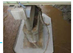
写真-2 豪雨後の橋脚の様子