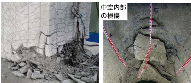
写真-1 最終損傷状況

につながるような損傷であり、これは充実断面のRC橋脚では一般には生じにくい現象です。中空断面の場合、壁になっている圧縮側コンクリートが圧壊すると断面に残される鉛直力に抵抗できる部分が急速に小さくなってしまふことが一因と考えられます。引張鉄筋比が大きい、軸方向鉄筋強度が高い等の条件により、軸方向鉄筋の負担する荷重の割合が大きくなると、コンクリートの圧壊がすすむ傾向が顕著に顕れると考えられます。