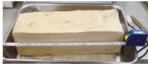
微生物を用いた土の固化の例