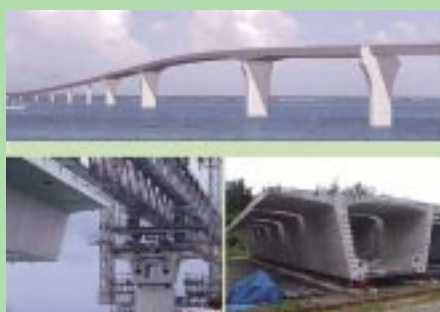
伊良部大橋（上は完成予想図）

例えば、構造物メンテナンス研究センター（CAESAR）では、平成21年3月、沖縄県および財団法人沖縄県建設技術センターとの3者で協定を結び、離島に架かる実際の海上橋を用いて、塩害およびASRに着目した一貫したデータの蓄積とその分析に基づく予測技術の開発を、次世代への100年プロジェクトとして立ち上げた。具体の取り組みとして、新設橋における建設当初からの長期観測環境の整備とデータ収集、および既設橋の塩害による被害状況の把握とデータの収集・分析を行っている。このため、21年度は新設の伊良部大橋で、建設時に点検のための計器や暴露供試体の製作を行い、コンクリートの品質、内在塩分量、鉄筋の防食状況と腐食量に関する建設当初の状態および今後100年にわたる経年の変化を計測することとしている。