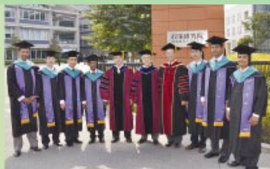
政策研究大学院大学での修了式