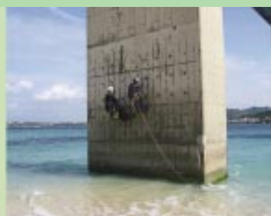
瀬底大橋における塩害調査