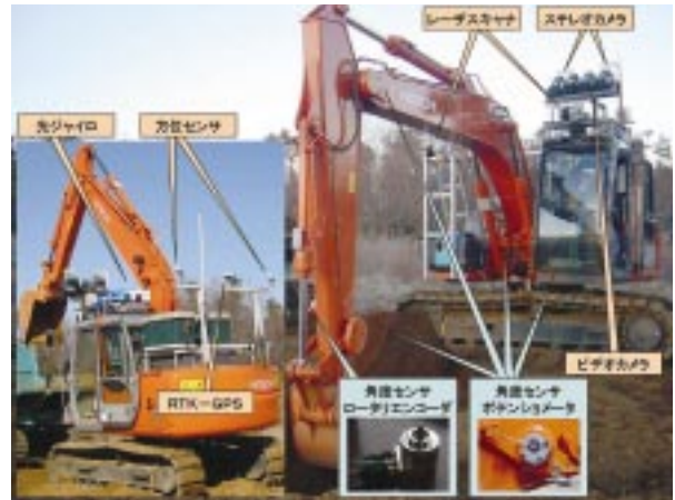
油圧ショベルによる掘削作業の自動制御技術に関する研究（計測機器類等の概観）