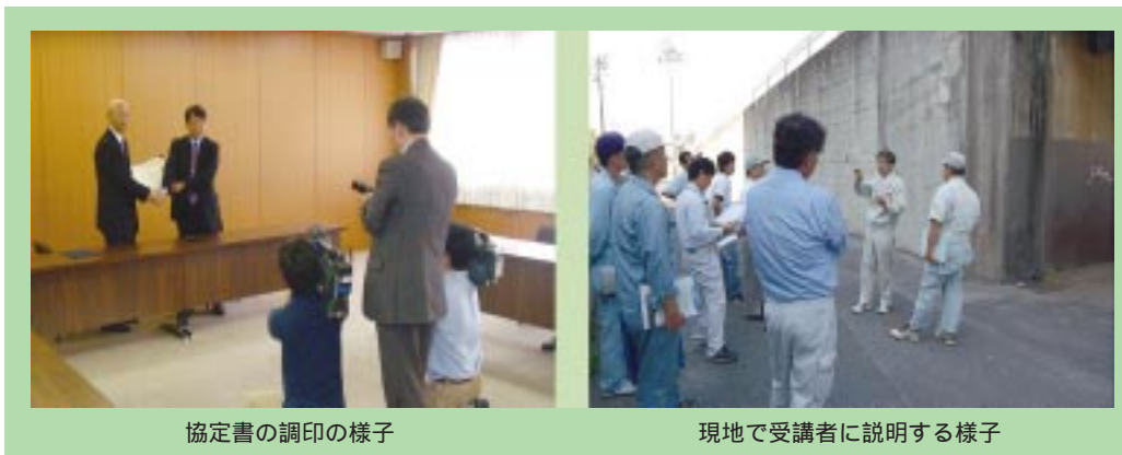
協定書の調印の様子

平成21年5月に、構造物メンテナンス研究センター（CAESAR）は、高松工業高等専門学校（同年10月より香川高等専門学校に名称変更）と「市町村の道路管理者の橋梁維持管理技術力育成に関する協定書」を締結した。本協定の締結により、CAESARからは講座で最新の損傷事例を紹介するなどの情報提供を行う他、損傷事例に対する技術的な助言など、高等専門学校や市町の自主的な取り組みへの支援を行った。今後、香川高等専門学校を中心として、全国の高等専門学校への展開も期待されており、引き続き協力していくこととしている。