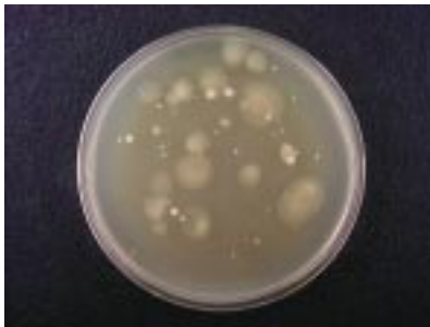
土中の微生物（泥炭中）の例