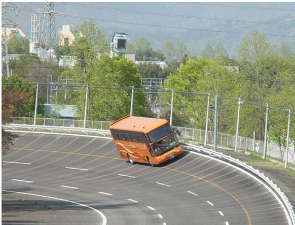
写真-1 試験走路による高速走行