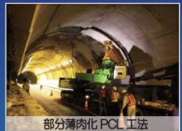
部分薄肉化 PCL 工法

展示・技術相談コーナー 9:30~18:00の間は、講演技術をはじめ土研の新技術等についてパネル等を展示し、技術相談をお受けするコーナーを設けます。 特に、12:15~13:30、15:25~15:45、17:00~18:00の間は、各技術の講演者または開発者が直接技術相談をお受けします。