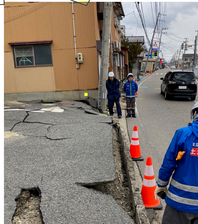
写真2 新潟市西区の液状化被害に関する調査