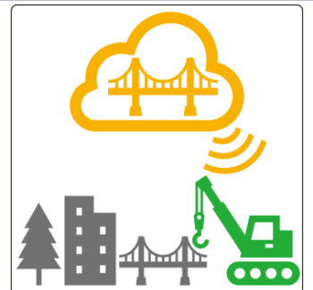
土研SiP事務局によるパネル展示