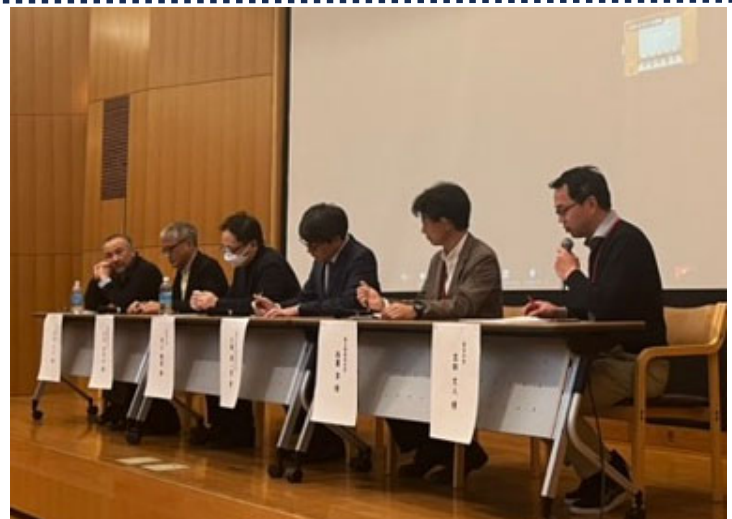
プロジェクトマネージャー（PM）・S I Pメンバーと専門家とのパネルディスカッションの様子