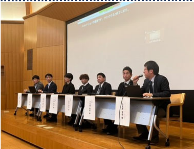
S I Pメンバーと地域の実務家との パネルディスカッションの様子

講演後は、講演者のパネルディスカッションのほか、聴講者からもご質問をいただき、闊達な意見交換が交わされました。グリーンインフラ技術の地域への実装を目標として、本シンポジウムのような様々な主体者が集まり議論する場を設ける等のアウトリーチ活動を今後も継続する予定です。