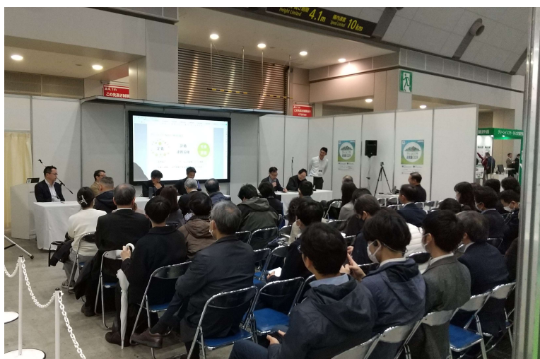
セミナー会場全体の様子