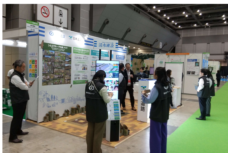
グリーンインフラ産業展 会場およびブースの様子