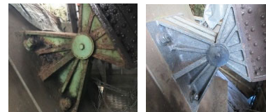
従来技術では施工困難だった部位のレーザー照射による処理例