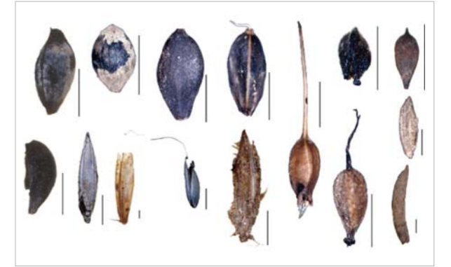
図1 礫洲で採取された種子の一部(種子右横のスケールは1mm)

野外調査と水路実験の結果から、礫洲への種子の定着は、沈降速度のみならず河床の状態や種子の形状にも影響を受けることが示唆されました。この要因としては、礫の遮蔽効果や礫間に生じる渦への取り込まれやすさが、礫の大きさや種子の形状によって異なるためではないかと考えられます。