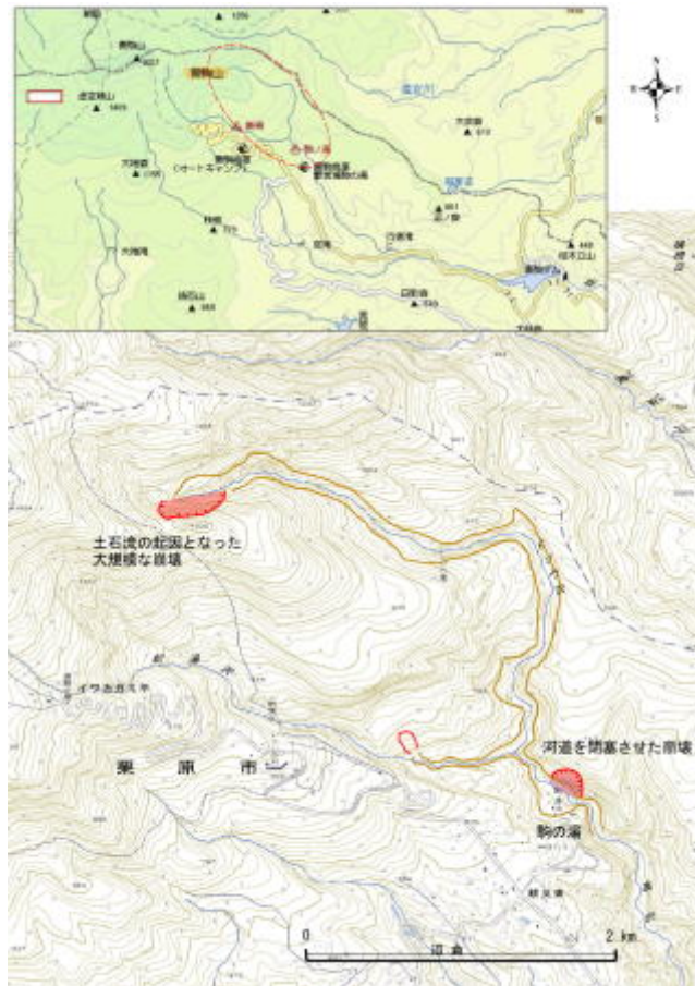
【調査位置および写真位置図（6月15日撮影）】

平成20年6月16日 （独）土木研究所 土砂管理研究グループ 火山・土石流チーム