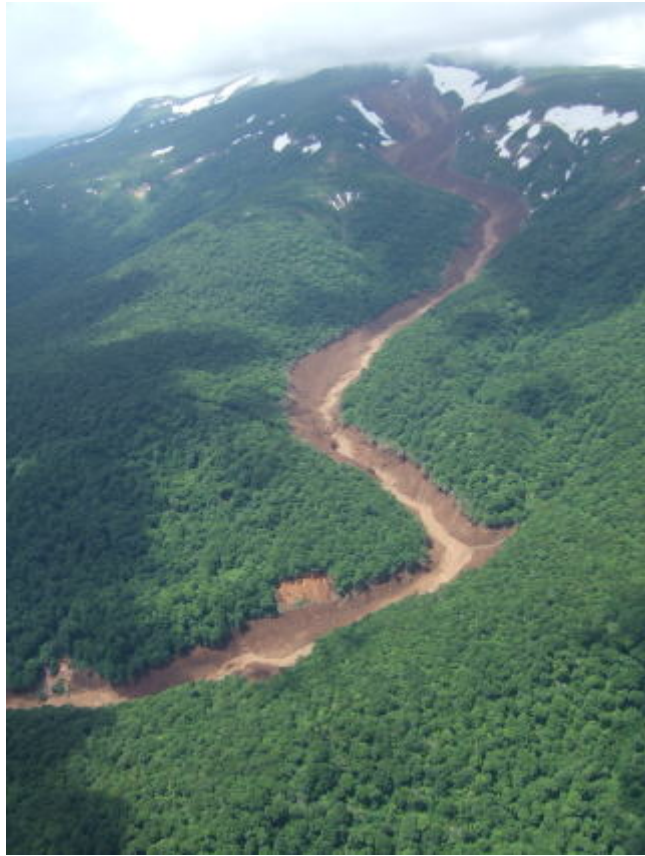
写真1 ドゾウ沢全景