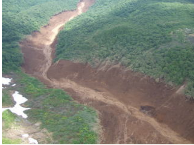
写真3 ドゾウ沢（崩壊地崩壊脚部）